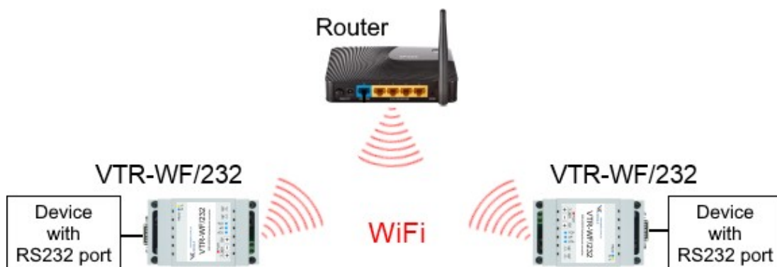
Рис 3. Зв'язок двох VTR-WF/232 за допомогою локальної мережі.

Недолік: Може зрости час обміну даними до кількох десятків або навіть сотень мілісекунд. Для деякого обладнання може бути критична затримка.