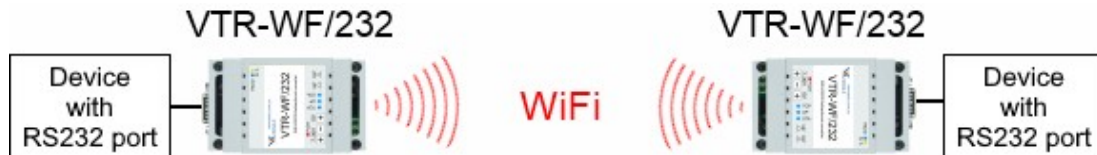
Рис 2. Зв'язок двох VTR-WF/232 безпосередньо.

Недолік: Дальність дії обмежена відстанню зв'язку по Wi-Fi.